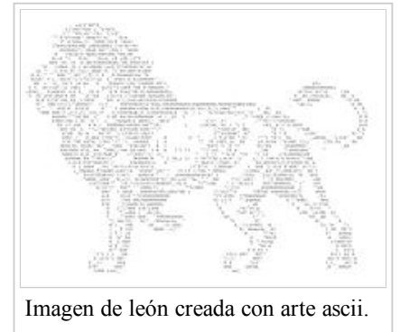
Imagen de león creada con arte ascii.

imprimibles ASCII. El efecto resultante ha sido comparado con el puntillismo, pues las imágenes producidas con esta técnica generalmente se aprecian con más detalle al ser vistas a distancia. El arte ASCII empezó siendo un arte experimental, pero pronto se popularizó como recurso para representar imágenes en soportes incapaces de procesar gráficos, como teletipos, terminales, correos electrónicos o algunas impresoras.